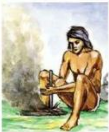
Добывание огня способом трения дерева о дерево